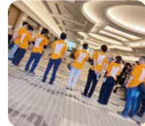
皆さんを お出迎えする最終確認。 プラカードは どこにいった??