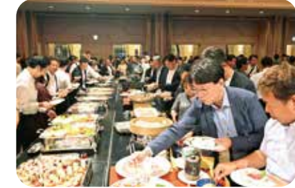
那須代表理事の舞で始まった懇親会。宮崎の郷土料理やお酒を楽しみながら分科会での学びを交流しました。