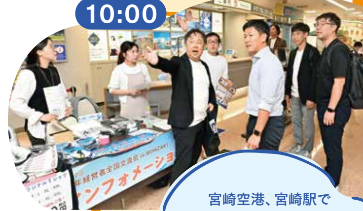
宮崎空港、宮崎駅で 県外からの参加者をお出迎え。 ようこそ宮崎へ! シーガイアでは、 キッチンカーもスタンバイ。