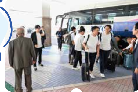
ぞくぞくと来られる 全国の会員さんの 受付開始!!