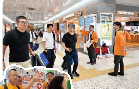
宮崎駅でも 周辺会場への ご案内!!