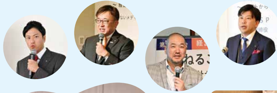
分科会スタート! 各分科会報告を聞いて 熱気のあるグループ討論で 学びを深めました。