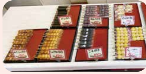
串だんごと季節の和菓子

近 年では原材料価格が高騰しており、直近の令和の米騒動はもち米の価格にも大きく影響しています。一部価格転嫁をせざるを得ませんでした。お客様のご理解により、売上は確保できている状況だと話します。 コンビニスイーツも和菓子が充実してきており脅威に感じているのですが、店内調理と素材をシンプルかつ最大限に生かした味をアピールして、店を将来につないでいきたいと展望を描いていました。