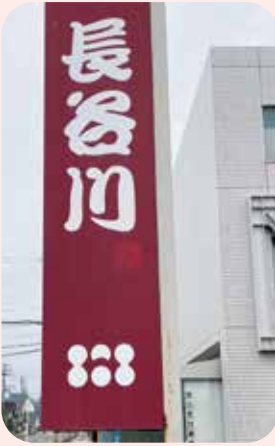
通りから見える看板。ロゴは串だんごと長谷川の頭文字Hを象っています。